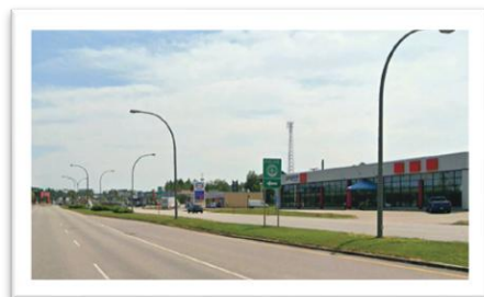
Simulation photographique représentant le site depuis le boul. La Salle, direction est