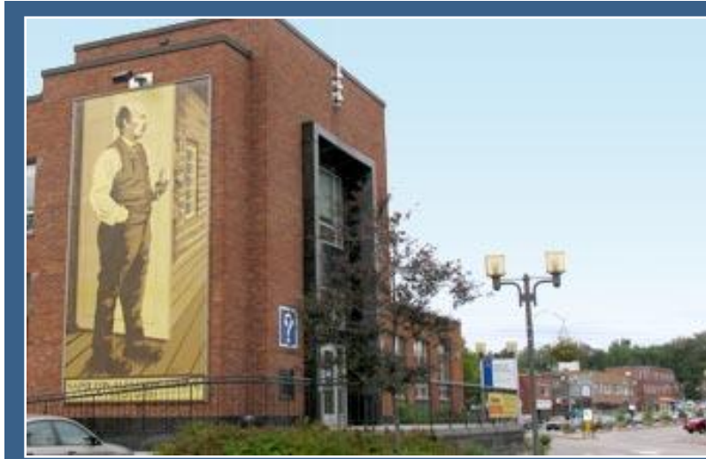
Assurances et réclamations

Afin de vous aider, un formulaire est mis à votre disposition. Ce formulaire est joint à la fin de ce document ou vous pouvez l'obtenir aux endroits suivants :