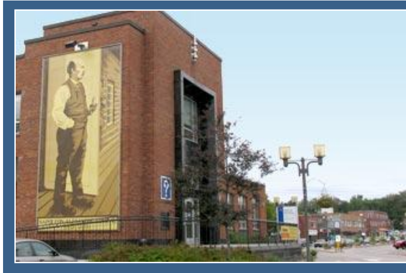
Assurances et réclamations

Afin de vous aider, un formulaire est mis à votre disposition. Ce formulaire est joint à la fin de ce document ou vous pouvez l'obtenir aux endroits suivants :